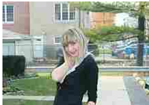
Le foto "strane" fanno impazzire il web