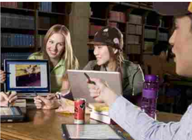
Guarda la gallery

Ha un'età media di 23 anni e in 6 casi su 10 è una studentessa. Questo l'identikit dello studente erasmus che nel 63% dei casi sceglie Spagna, Francia, Germania e Regno Unito come destinazione per studio, dove resta per 6 mesi e mezzo. La penisola iberica è la meta più scelta anche per i tirocini, seguita dal Regno Unito, questo tipo di attività dura in media 4 mesi. Se si guarda all'accoglienza, il Lazio è un grande polo di attrazione per gli studenti europei, in quanto ospita ogni anno accademico circa 2.640 universitari stranieri (66% studentesse), che arrivano da Spagna, Francia, Germania e Polonia. Roma è la città italiana che accoglie il maggior numero di studenti, che in media hanno 22 anni e trascorrono nella regione 7 mesi. L'ateneo che nella regione ha il numero più alto di studenti europei è La Sapienza, dove studia oltre il 43% dei giovani presenti nella regione. Nella classifica europea, che mette in evidenza i primi 10 Atenei più attivi in Erasmus , occupa il 14° posto nell'ambito della mobilità in uscita ed è ottava per numero di studenti stranieri che la scelgono come destinazione.