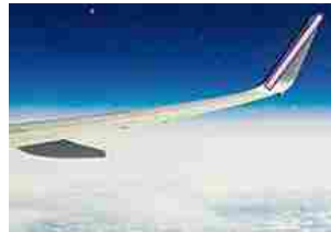
Tenerife, scoperta una base aliena gigantesca