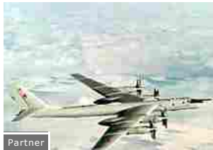
Partner La Raf intercetta due bombardieri Bear, convocato l'ambasciatore russo