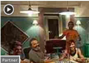
Partner Claudio Amendola irrimediabile torna alla commedia: in esclusiva 2 minuti di "Noi e la Giulia" (Warner Bros su Youtube)