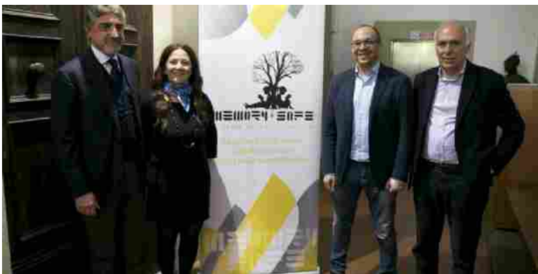
Il progetto "Memory safe".

Tutto su: Cultura Giovani Lavoro Salute Scuola Sicurezza Territorio Regioni Istruzione Ministero del Lavoro Roma