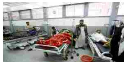
IMMAGINE DEL GIORNO

Guerra in Yemen, Msf denuncia atroce emergenza umanitaria