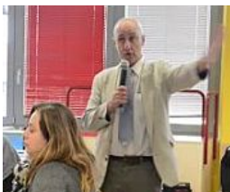
La scuola hi-tech, al Fermi approda il metodo del Mit