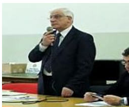
La lezione antimafia di un imprenditore che sfida la 'ndrangheta