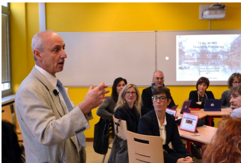
Docenti del Fermi a lezione con l'esperto del Mit