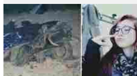
Sorpasso choc: Agnese, 16 anni, muore sull'auto guidata dal fidanzato