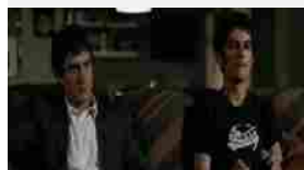
Giovani malpagati: tanti contributi ma avranno pensioni da miseria