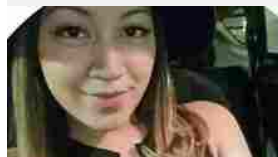
Per 10 ore a 150° sotto zero: muore a 24 anni nella criocamera di bellezza