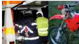
Prova la moto regalata al figlio: papà si schianta e muore sul colpo