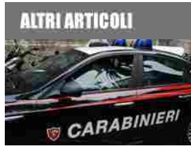
Cesena: uccide la moglie a coltellate davanti ai figli, poi chiama i carabinieri

Sponsor Bocconcini di pollo con prugne e timo (salepepe.it)