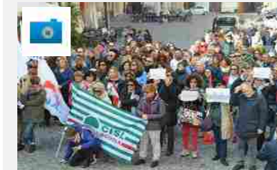
Scuola agitata, la manifestazione ad Ancona