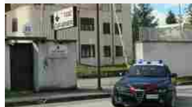
Brindisi: pestano 25enne, tentano di violentarlo e lo lasciano nudo in strada