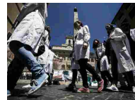
Giovani medici ok nuova specializzazione - Normativa