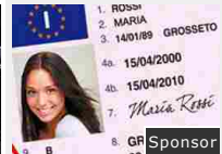
AAA cercasi passaggi. Offri un passaggio e risparmi i soldi della benzina!