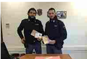
Due chili cocaina, arrestati 2 corrieri