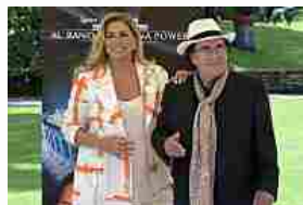
Al Bano su caso Ylenia: Mi hanno prelevato Dna, ma nuova pista è...