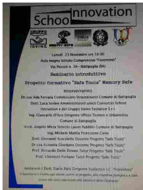
Istituto S Fiorentino

La prevenzione degli infortuni e delle malattie professionali rappresenta un obiettivo centrale per l'Italia, solo che si considerino i sempre troppo elevati (per quanto in costante calo negli ultimi anni) indici infortunistici e, soprattutto, i drammi umani e familiari che sono legati alla persona che si infortuna o si ammala a causa del lavoro.