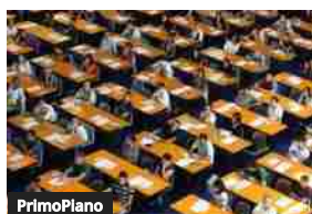
PrimoPiano Dalla Buona Scuola al Concorso a Cattedra: precari e non abilitati,