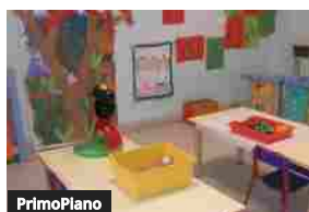
PrimoPiano Concorso Scuola: la preparazione del docente nella nuova scuola