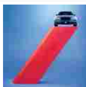
AXA Assicurazione Auto

Adotta un bambino a distanza. Cambierai due vite...una è la tua Adotta ora