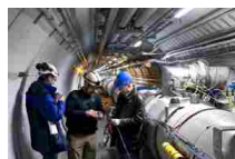
Scienza: al Cern riparte il superacceleratore Lhc