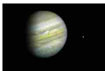
Giove colpito da un asteroide: il video mozzafiato