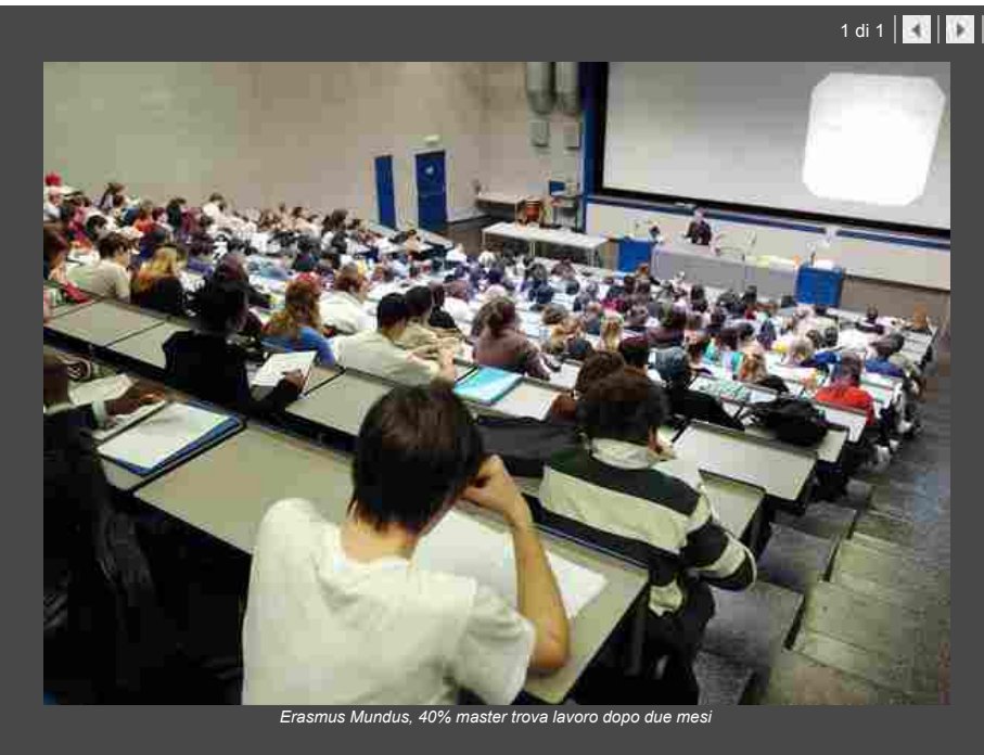
Erasmus Mundus, 40% master trova lavoro dopo due mesi

Indietro Stampa Invia Scrivi alla redazione Suggestisci ()