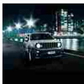
Jeep per il business

Renegade a 199€/mese con manutenzione, garanzia Richiedi Preventivo!