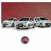
Fiat per il business

Renegade a 199€/mese con manutenzione, garanzia Richiedi Preventivo!