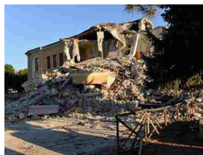
Crollata nonostante i lavori. Vennero assegnati e spesi 700 mila euro - Il giallo dei 21 milioni destinati agli edifici privati - F. Sarzanini

di Giovanni Bianconi, Francesco Di Frischia