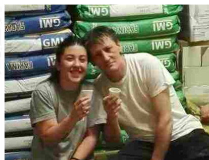
È nella lista dei dispersi di Amatrice Le vittime del sisma: volti e storie