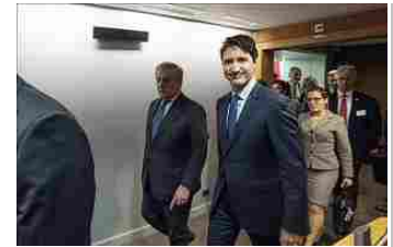
altre foto Parlamento Europeo su Flickr