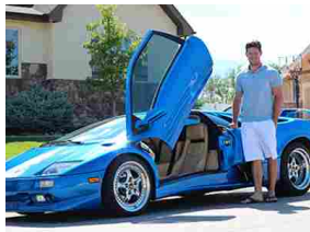
Un milionario 27enne parla del suo lavoro da 500€ all'ora. Scopri di più...