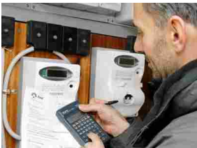
Come far rallentare Il vostro contatore di 2 Volte E risparmiare del 50%?