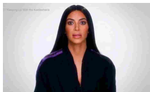
20/03/2017 Kim Kardashian parla dopo la rapina: "Sapevo che mi avrebbero stuprata"