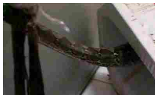
26/05/2016 Un pitone di 3 metri sbuca dal water, attacca un uomo e gli morde il pene