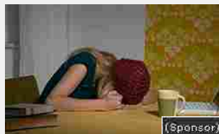
16/05/2017 Stare così o cambiare PC? Il top di gamma Microsoft e Intel oggi è in offerta sp...