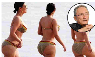
02/05/2017 La fine del mito del sedere della Kardashian: se l'illusione è digitale