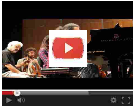
Festival d'Europa 2017

Da non perdere la conferenza The State of the Union , il programma live di Erasmus+ sul palco in piazza SS. Annunziata, la Notte Blu alle Murate, i convegni all'Università e gli eventi a La Compagnia