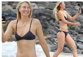
I 30 anni Sharapova: trofei, glamour e ombre doping