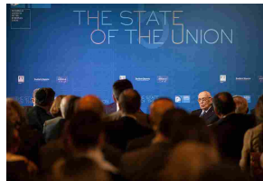
Firenze: iniziato il Festival Europa