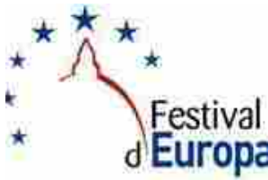
A Firenze il primo Festival d'Europa