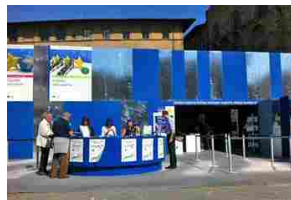
Nice to meet EU