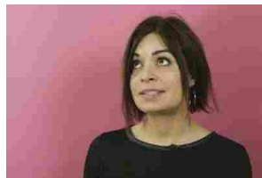
Grazie a questa app, parlerai una nuova lingua in 3 settimane!