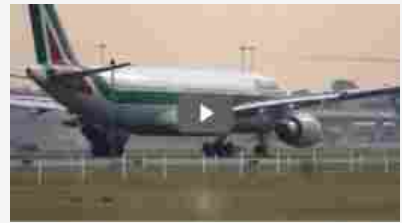
La giornata in 30 secondi - 2 maggio 2017