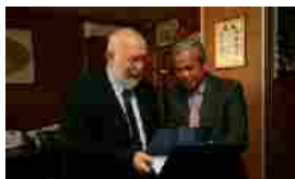
Unical, oggi l'ambasciatore del Vietnam in visita al campus