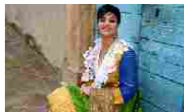
A Cosenza il mese di maggio è albanese