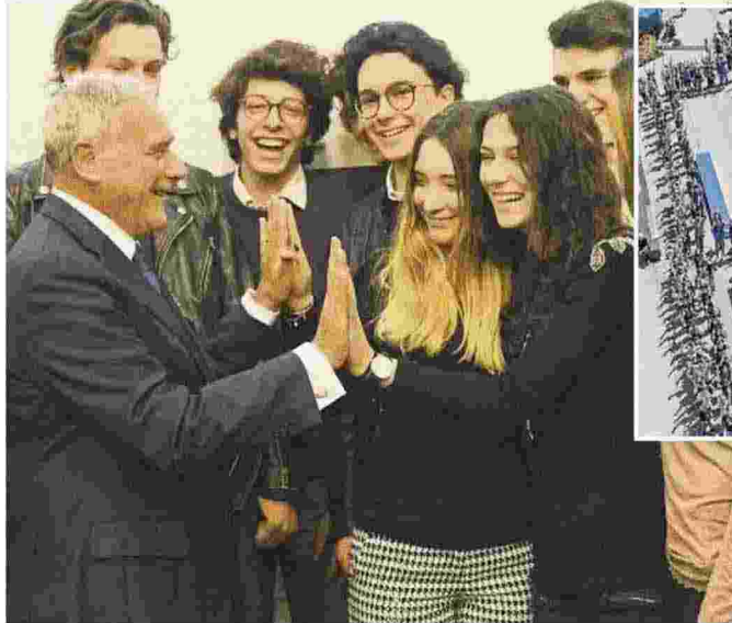
Il presidente del Senato, Pietro Grasso scherza coi ragazzi; a destra la grande «E» formata dagli studenti

In piazza SS. Annunziata l'esordio dell'Orchestra dei conservatori e