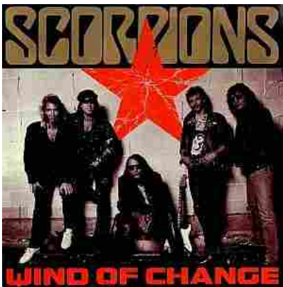
"Wind of Change" degli Scorpions, uno dei brani scelti per la playlist Erasmus

Nel 1987 suonavano hit come "With or Without you" degli U2 o "I Wanna Dance with somebody" di Whitney Houston. Oggi imperversano in radio "Chained To The Rhythm" di Katy Perry e "Shape Of You" di Ed Sheeran. Erasmus vuol dire avventura, nuove amicizie, luoghi da esplorare e piatti da assaggiare. Ma Erasmus vuol dire anche musica ed è per questo che nei giorni in cui si festeggiano i 30 anni dalla nascita del programma di studio internazionale per eccellenza, l'Agenzia Erasmus+