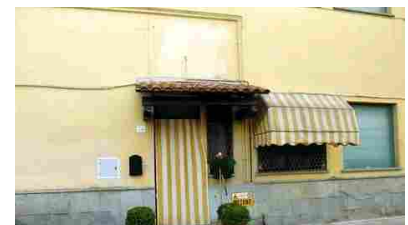
Appartamenti Via della Chimera n.74 - 80300

Istituto Vendite Giudiziarie di Siena Istituto Vendite Giudiziarie di Arezzo