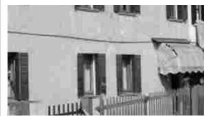
Cavarzere via Rottanova 67