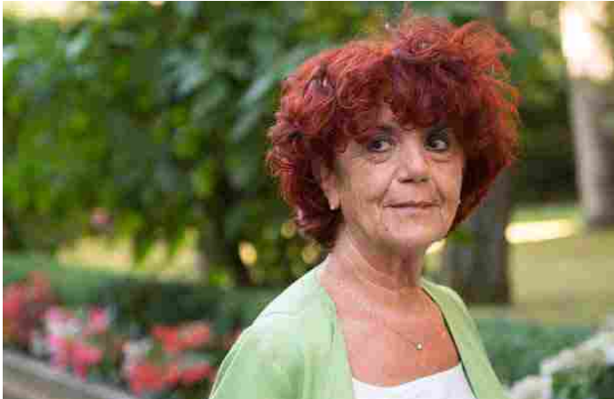
Valeria Fedeli

Ed ecco che ora il ministro - ministro, mi perdonerà la neolingua boldriniana! - dell'Istruzione Valeria Fedeli asserisce trionfale che occorre rendere obbligatorio L'Erasmus per tutti e anticiparlo già alle scuole superiori. Quod erat demonstrandum! Abbiamo rimosso la leva obbligatoria e abbiamo messo come nuova naia L'Erasmus , per rieducare i giovani al globalismo post nazionale.