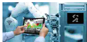
Industria 4.0: le opportunità per progettare il futuro mercoledì 20 settembre - 15:41