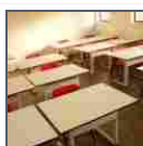
Scuola, iscrizioni on line al via. La domanda entro il 22