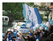
Mercato D: Sangiovese, in vista bomber Bonini giovedì 21 settembre - 15:41