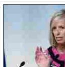
Scuola, il ministro Giannini lancia Premio nazionale