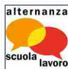
Scuola-lavoro: firmato Protocollo tra Miur e Polo

Siamo spiacenti, ma il browser che stai utilizzando non è al momento supportato. Disqus supporta attivamente i seguenti browsers: