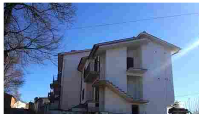
Appartamenti Via Ferrara - 62730

Istituto Vendite Giudiziarie di Siena Istituto Vendite Giudiziarie di Arezzo