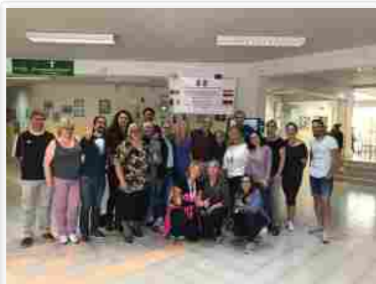
L'Istituto "Manzoni" di Priolo

A Priolo Gargallo il 2° I. C. "A. Manzoni" ospita con sport studenti stranieri per l'Erasmus+ "Fair Play 4 UE"