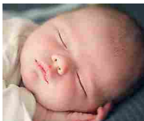
Nomi vietati per i neonati: ecco gli otto proibiti per legge