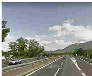
Avellino - Salernitana, agguato sul raccordo autostradale