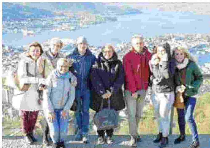
Il gruppo di progetto al primo meeting di Bergen