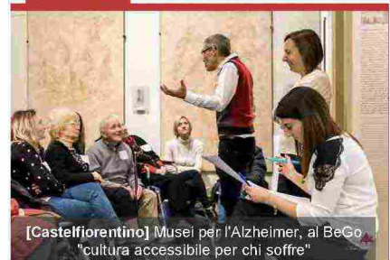
[Castelfiorentino] Musei per l'Alzheimer, al BeGo "cultura accessibile per chi soffre"