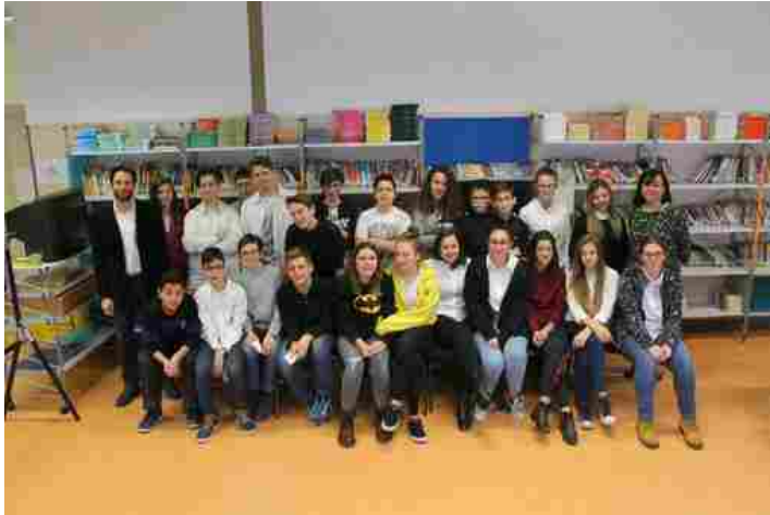
La classe 3 D che partecipa al progetto Erasmus

Gli studenti della classe 3° D della scuola secondaria di primo grado dell'Istituzione Scolastica Eugenia Martinet di Aosta hanno avviato uno scambio culturale e linguistico con gli alunni del Collège Audembron di Thiers, in Auvergne. Gli studenti francesi visiteranno Aosta dal 18 al 24 marzo, durante la "Semaine de la francophonie" e quelli valdostani saranno a Thiers dal 21 al 27 maggio.