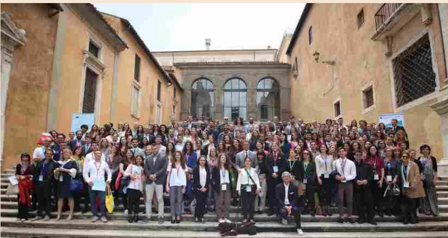
A Roma 200 universitari da tutti i paesi Ue partecipano agli Stati generali Erasmus