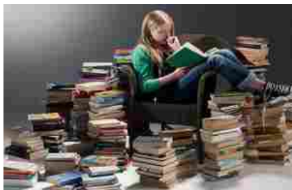
Un contratto da azzeccarbugli

Indire ha predisposto un questionario sull'utilizzo del libro di testo, rivolto ai docenti di tutta Italia, chiedendo loro, attraverso un questionario domande del tipo: Qual è il rapporto che i prof hanno con i libri di testo? A che punto è il processo di integrazione tra contenuti cartacei e digitali? Qual ruolo ha il libro nell'attività didattica? Ecc.