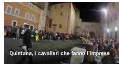
Quintana, i cavalieri che fanno l'Impresa