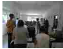
Summer School Gissi