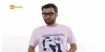
Digital World 3 - Tra futuro e futuribile P.17