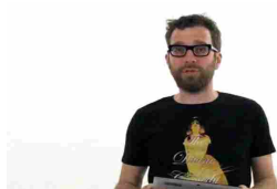
Digital World 3 - Tra futuro e futuribile P.18