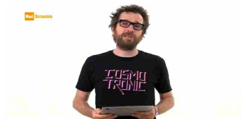
Digital World 3 - Tra futuro e futuribile P.16