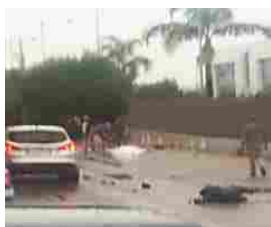
Incidente mortale sulla Sp231 in territorio di Bitonto