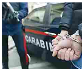
Finziere bitontino arrestato per concussione