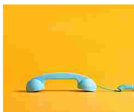
Confronta 35 Offerte telefonia fissa: risparmi fino a 250€