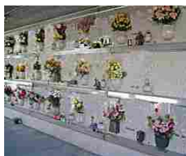
«Illuminazione votiva, a chi si deve pagare il canone 2018?»