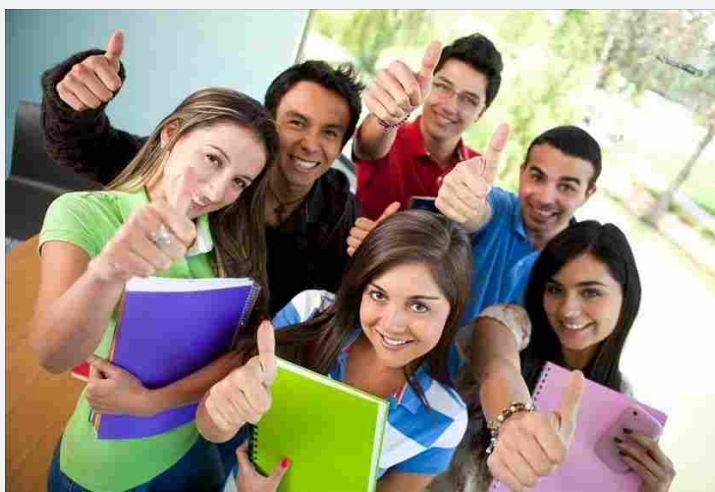
Studenti in tirocinio all'estero

ATTUALITÀ Bitonto giovedì 11 ottobre 2018 di La Redazione