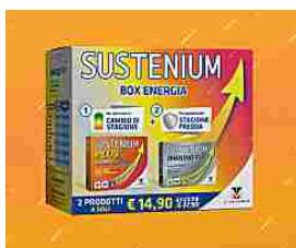
Acquista due prodotti SUSTENIUM in un’unica confezione