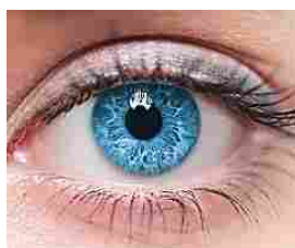
Un video creativo per un’azienda vale più di 1 mln di views!