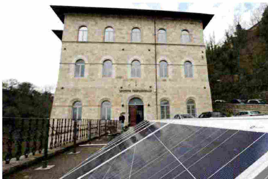
L'Its Energia e Ambiente di Colle di Val d'Elsa

Regione e Fondazioni insieme garantiranno perciò un maggior numero di corsi