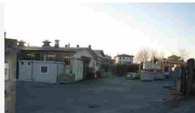
Capannori frazione Marlia, via dei Fanucchi - 409600

Con "Leggere: forte! Ad alta voce fa crescere l'intelligenza" la Regione Toscana punta a introdurre gradualmente in tutte le scuole di ogni ordine e grado la lettura ad alta voce quale strumento per lo sviluppo delle competenze cognitive di base dei bambini e dei ragazzi, del potenziamento della loro capacità intellettuale, delle abilità relazionali, delle emozioni, dello sviluppo del pensiero critico.