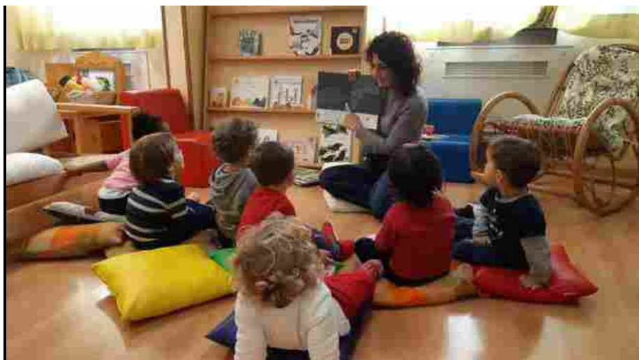
Letture ad alta voce

Arezzo 28 marzo 2020 - "Si chiama Covid, è un piccolo mostriattolo che sogna di invadere il mondo e sporcare tutto il resto della popolazione attraverso palline di sporco. Gli abitanti si rendono conto, dopo esser stati sporcati, che se non si fossero lavati le mani avrebbero infettato a loro volta. Decidono allora collettivamente di chiudersi in casa così da lasciare Covid solo soletto, costringendolo a rientrare nella sua sporca casetta". Parole semplici per spiegare ai