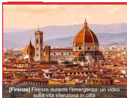
[Firenze] Firenze durante l'emergenza: un video sulla vita silenziosa in città

Il gruppo Maker@Scuola di Indire è impegnato nel monitoraggio delle più