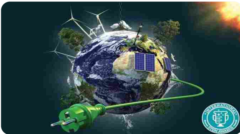
International STEM Awards Digital Experience

Sabato 23 Maggio 2020 andrà online dalle 10 alle 17 l'evento dedicato alle discipline STEM che permette ai giovani di proporre e condividere soluzioni innovative ai problemi di interesse globale