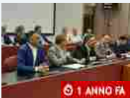
Politica Mareggiata di ottobre, il punto in Provincia, Toti e Giampedrone: "200 milioni di euro in arrivo, patto di sinergia con i sindacati per spenderli al meglio"