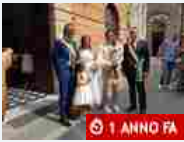
Attualità Albenga, celebrato in Comune il matrimonio programmato nel "Jova Beach Party" (FOTO)