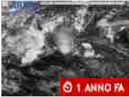
Cronaca Maltempo, arrivano i temporali: l'allerta diventa arancione