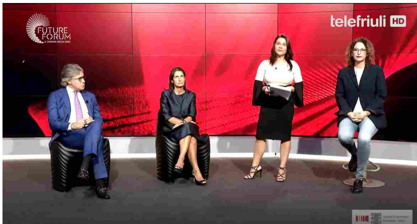
Dieci mini-trasmissioni a tema in tv su Telefriuli, sul Messaggero Veneto e UP!Economia e condivise sui siti e social della Cciaa, della tv e del giornale, per rendere più capillare possibile la riflessione sul futuro

Come cambiano le relazioni internazionali, i mercati e le rotte commerciali, e quali nuovi assetti geopolitici influenzeranno l'economia e la finanza? Come saranno organizzate le città e i territori del prossimo futuro? Quale sarà l'impatto dell'automazione sulla produzione e della tecnologia su scuola e lavoro, e come conciliare ambiente, produzione e vita quotidiana? Ma soprattutto: come impatta l'emergenza Covid in tutto questo e come sta incidendo sul corso degli eventi, modificandone inevitabilmente la rotta rispetto a quella che ci eravamo immaginati? Queste grandi domande hanno mosso l'edizione 2020 di Future Forum, il “festival” di idee e progetti per il futuro voluto e realizzato fin dal 2010 dalla Camera di Commercio Pordenone-Udine, manifestazione che si è appena conclusa in una versione inedita: 10 mini-approfondimenti di