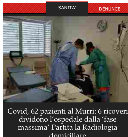
Covid, 62 pazienti al Murri: 6 ricoveri dividono l'ospedale dalla 'fase massima' Partita la Radiologia domiciliare