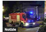
Fuoco nella notte a Gallipoli, le fiamme divorano Renault Mégane di...

Fondazione ISTUD è la prima business school indipendente italiana, nata nel 1970. ( www.istud.it ). Il suo obiettivo è quello di promuovere e diffondere espressioni della cultura, con particolare riferimento alla cultura di impresa e di gestione attraverso l'ausilio della formazione continua e della ricerca. ISTUD opera nelle organizzazioni in