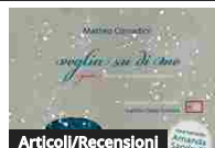
Articoli/Recensioni Accademia Nazionale di Santa Cecilia, il nuovo libro per ragazzi è...

Sotto l'Alto Patronato del Presidente della Repubblica il progetto "Farulli 100" ha ottenuto il patrocinio di Regione Toscana , Città Metropolitana di Firenze , Comune di Firenze , Università degli Studi di Firenze e LENS Laboratorio Europeo di Spettroscopia Non Lineare . È realizzato con il contributo di MiBACT , Fondazione CR Firenze , Fondazione Alimondo Ciampi e con il sostegno di Unipol , Terna , Enel , Intesa Sanpaolo , Poste Italiane , Erasmus + Agenzia Nazionale Indire e Unicoop Firenze , in collaborazione con Giunti Scuola , con il Ministero dell'Istruzione - Comitato nazionale per l'apprendimento pratico della musica . Media partner Il Giornale della Musica .