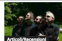
Articoli/Recensioni I bemoli sono blu | AB Quartet