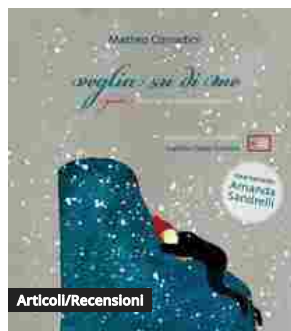
Articoli/Recensioni Accademia Nazionale di Santa Cecilia, il nuovo libro per ragazzi è...