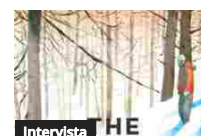
Intervista The Milky Way - Nessuno si salva da solo