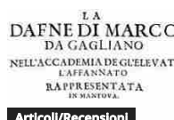
Articoli/Recensioni Opera in Pillole: "La Dafne" di Marco da Gagliano