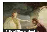
Articoli/Recensioni Opera in pillole: "L'Euridice" di Ottavio Rinuccini