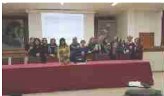
"WeDebate" all'Istituto Alberghiero Costaggini 29 Novembre 2018 In "Notizie e comunicati"