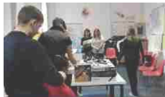
Istituzione Formativa e Caritas insieme per chi si trova in difficoltà 24 Dicembre 2019 In "Chiesa Locale"