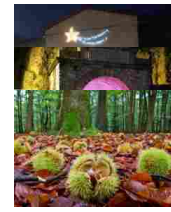
Naturale Navegna Cervia per la raccolta semiautomatica delle castagne

2 milioni di euro per i progetti APS inaugura la sede operativa e dedicato alla salute