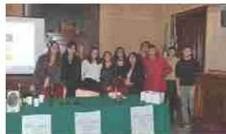
Rieti Digital, conclusa la seconda edizione 18 Novembre 2019 In "Rieti"