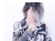
musica) di Maru

GRMUSICA A CURA DI DIREGIOVANI.IT ASCOLTALO ON LINE E IN RADIO