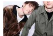
Sanremo 2021, alla scoperta delle Nuove Proposte: Davide Shorty