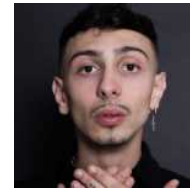
Le celebrità che dovrete assolutamente conoscere: David Gilmour